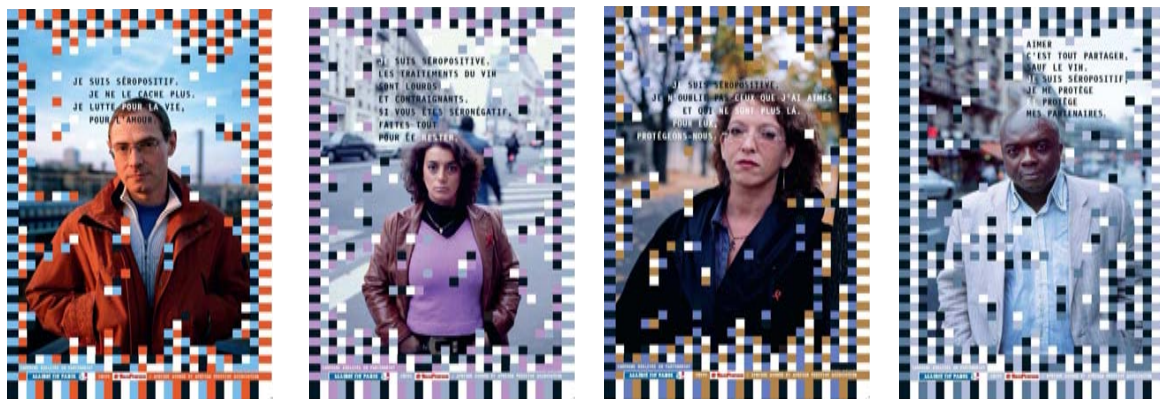
Visuels de la campagne

Cette campagne est visible dans tout Paris, à partir du 26 novembre, jusqu'à la mi-décembre. Les quatre personnes, d'origines et de cultures différentes, adressent à tous les Parisiens un message de sensibilisation sur l'importance de la prévention.